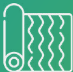
Textil y cuero

En Medir Ferrer tenemos los productos que satisfacen las necesidades de los diferentes segmentos de la industria: