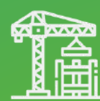
Edificación y construcción