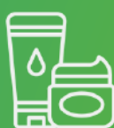
Cosmética y cuidado personal